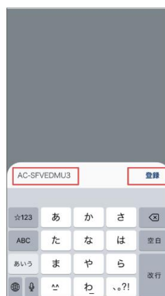
3. チケットコードを登録します ※アプリをDL済みの場合、URLをクリックするとこの画面に遷移します