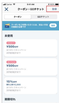
2. 右上の登録をタップします