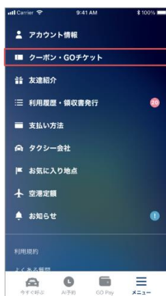
1. GOアプリのメニューからクーポンを選択します