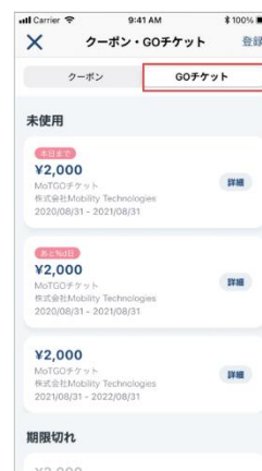
4. GOチケットが登録されるとメニュー内にGOチケットが表示されます