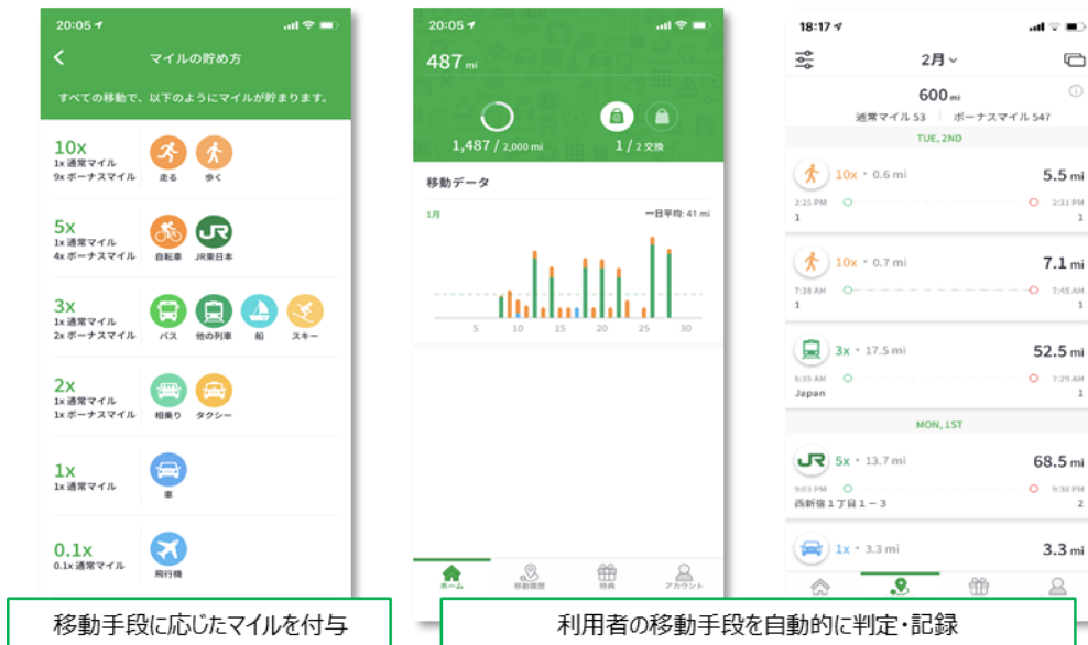
移動手段に応じたマイルを付与