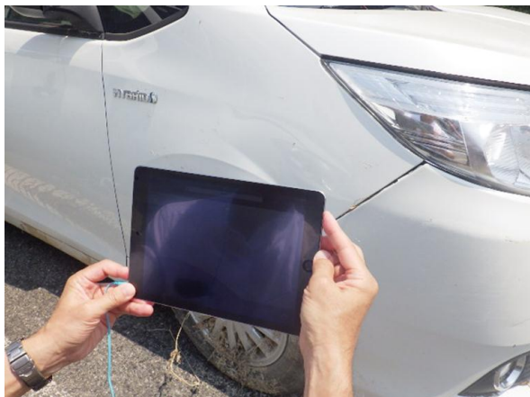
バックアップセンターのアジャスターと会話しながら、冠水車両の外観を撮影