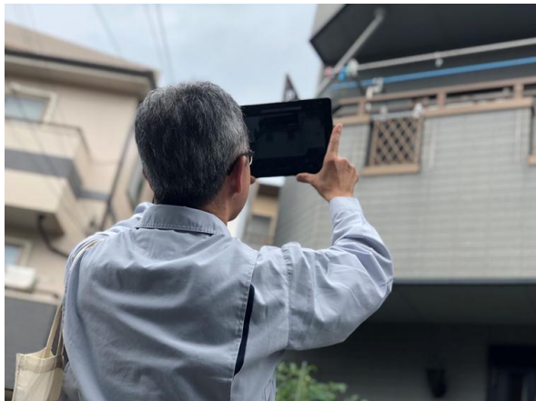
バックアップセンターの鑑定人と会話しながら、地震被災家屋の外観を撮影