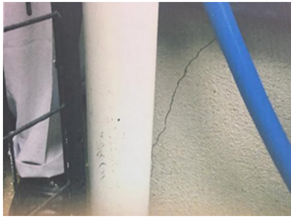
バックアップセンター側で受信している損害画像。家屋の基礎の亀裂が鮮明に確認できる。