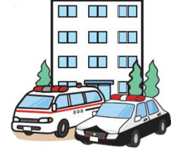
警察・消防等が現場へ急行