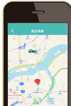
出動車両の接近情報