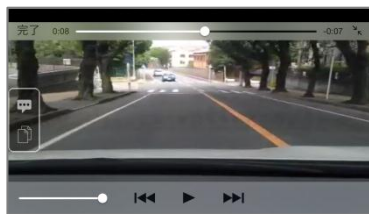
ドライブレコーダー機能

スマートフォンをお車に載せて運転することで、お車の急制動や衝突を検知して、その前後の映像を自動的に録画・保存します。危険時の映像を確認することで運転力の向上を促し、万が一の事故時にも状況記録として役立てられます。また、同時に運転傾向を加速・減速の安定性やコーナリングの安定性などの5つのポイントで分析・診断します。