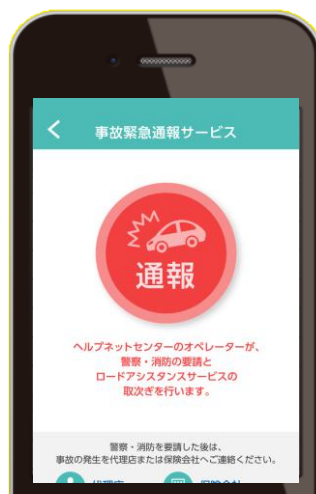
事故緊急通報サービス ワンタッチで要請