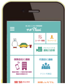
緊急通報ボタンを押下

事故によるパニック状態ではどこに連絡すべきかの判断、事故現場の正確な位置の説明などを冷静に行うことは困難です。そこで、専門のオペレータがアプリから受信した位置情報とお客さまからのヒアリングをもとに消防・警察・ロードサービスデスクへ連絡を行い、緊急車両の要請を代行します。