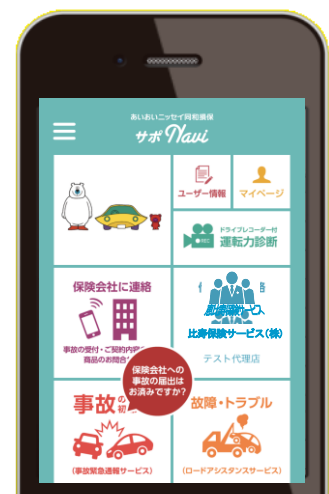
事故現場での行動を ナビゲート