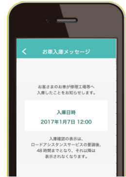
入庫完了のお知らせ