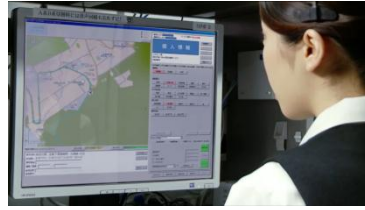
専門のオペレータが警察・消防等を要請